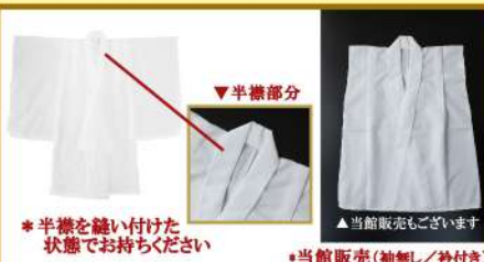
長襦袢 (ながじゅばん)